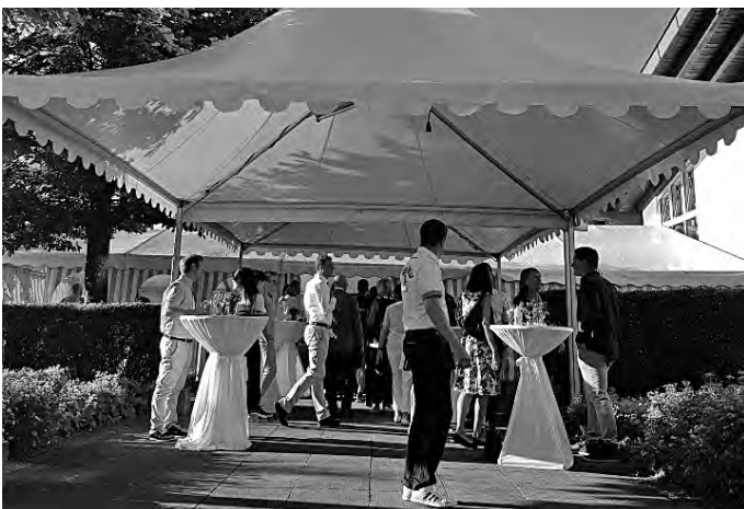
Hereinspaziert: Der Gala-Abend kann beginnen, es müssen nur noch alle 180 Gäste an ihren Tischen Platz nehmen.