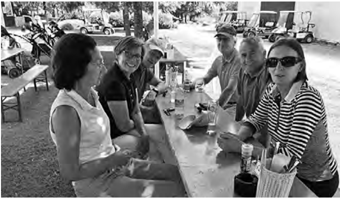
Schöner Schatten: Weil die Terrasse wegen des Gala-Zelts gesperrt war, konnte man sich auf Bänken nach dem Golfspiel erfrischen. Da war das Bier des Sponsors Paulaner vom Turnier am Vortag sehr willkommen.